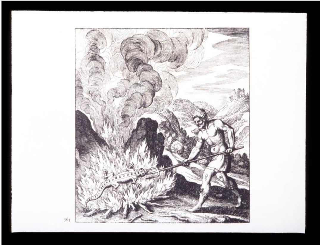
Figura 3: Prancha X do Tratado de Lamspring. “O autor trabalhando com a salamandra no fogo”.

A compreensão adquirida não é suficiente, embora tornou-nos aptos para o trabalho de integração e aceitação das manifestações dos complexos e assim, desenvolver ainda mais nosso entendimento. “Não é fácil descrever esse evento. Trata-se sempre de período muito instigador e crítico na vida da pessoa no qual ela precisa dedicar-se total e nuamente à tarefa e na qual também está nua, no sentido de estar desprotegida e exposta” (Fierz, 1997, p. 356).