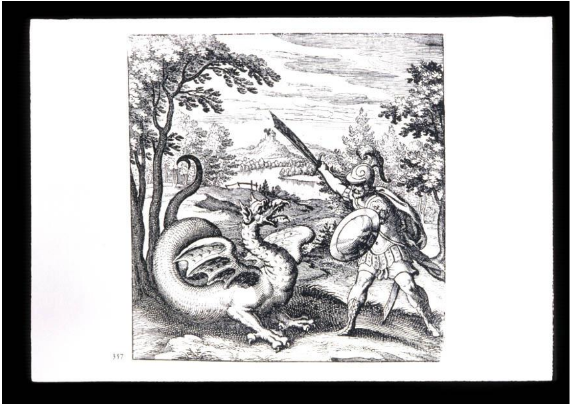
Figura 2: Prancha número II do Tratado de Lambspring. “A luta com o dragão”.

O trabalho da análise lança luz na escuridão dos complexos inconscientes e um lento processo de mudança começa a acontecer. A verbalização e o reconhecimento dos conteúdos emocionalmente carregados, a amizade com os sonhos, fantasias e imagens ajuda a tornar conscientes as projeções, as defesas, as manias.