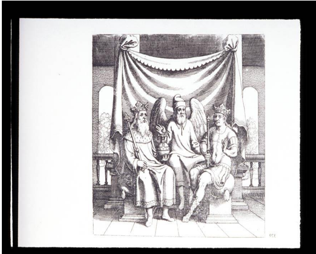
Figura 5: Prancha número XV do Tratado de Lamspring. “O pai e o filho agora estão unidos”.

A análise proporciona mudanças para melhor através da descoberta e compreensão do que acontece no psiquismo. E o resultado de uma análise que desenvolve a consciência é sempre sentido como algo muito reparador. “Pela compreensão, o inconsciente é integrado, criando-se assim, pouco a pouco, um ponto de vista superior, que representa simultaneamente a ambos, consciente e inconsciente” (Jung, 2012, §479, OC 16/2).