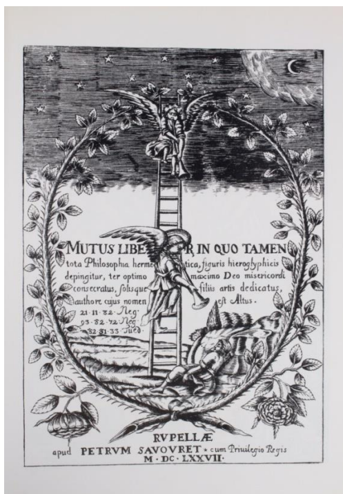
Fig.1 Prancha 1 do Tratado Mutus Liber. (1995)

Dentro disso, a música tem o poder de constelar emoções das mais diversas, e de forma intensa. Primeiro é uma expressão de um aspecto emocional e afetivo interno de quem compõe, de forma que faz com que o compositor ou músico ao criar e tocar uma música, coloca tudo de si ali, o chamado feeling . Ao mesmo tempo, o sujeito que ouve a música é inundado por melodias e letras que evocam muitas emoções em si, que mudam seu dia, que lhe fazem lembrar de fatos anteriores, desperta aspectos que estavam há muito tempo submersos em seu inconsciente. A música transforma. A música desperta, como ilustra a primeira prancha (fig.1) do tratado alquímico Mutus Liber , que demonstra a necessidade de ‘acordar’ da inconsciência para que o trabalho alquímico de transformação inicie: