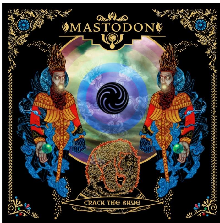
Fig.2 Capa do álbum Crack theSkye da banda Mastodon ( 2009)

O álbum escolhido para ser analisado nesta monografia é “ Crack the Skye ” (fig.2 e fig.3). É um álbum rico em símbolos desde sua arte gráfica até as letras das músicas.